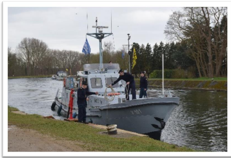
V901 Leie (Ex-patrouilleschip van de Marine), maakte deel uit van de Rijn flottielje

Op dinsdag 3 april hebben we ons opgesplitst. De deelnemende schepen met uitzondering van de “V901-Leie” vertrokken 's morgens al naar MOL “Port Aventura”.